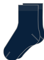
Style # HFM 210E