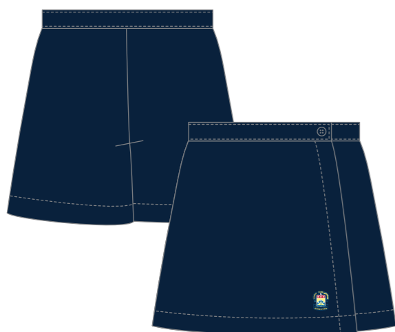
Style # SJB 021E Jupe-culotte Gabardine