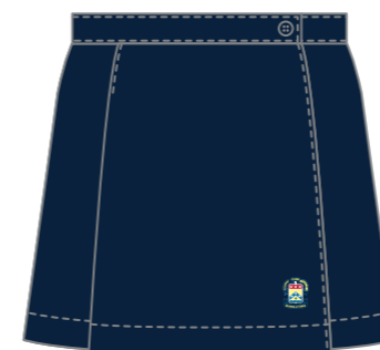
Style # SJB 018E Jupe portefeuille Gabardine