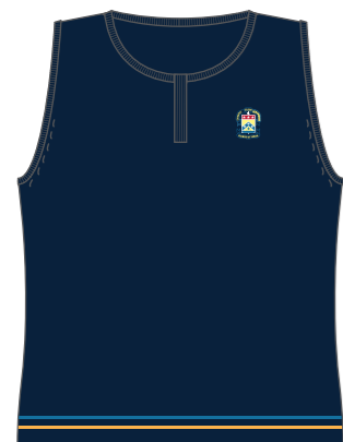
Style # SJB 016E Débardeur Fine maille côtelée 1x1