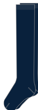
Style # HFM 212E